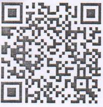
ГРАФИК ПЛАТЕЖЕЙ* к договору (контракту) от 10.10.2022 г. № 25

между KANJALTIV MCHJ и Ховос туман ХТБ на общую сумму 123725000,00