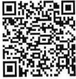
ГРАФИК ПЛАТЕЖЕЙ* к договору (контракту) от 19.10.2022 г. № 391-2-34-МТ/2022

между Строй Мега МЧЖ и Гиждувон туман МТБ на общую сумму 485500000,00