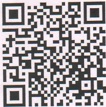
ГРАФИК ПЛАТЕЖЕЙ* к договору (контракту) от 14.10.2022 г. № 157817

между Сув тежовчи сугориш технологиялари илмий-тадкикот консалтинг маркази и Жанубий Мирзачул магистрал канали бошкармаси на общую сумму 99000000,00