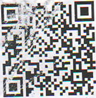
ГРАФИК ПЛАТЕЖЕЙ* к договору (контракту) от 26.10.2022 г. №11

между "Optimus Industry" ООО и Ангрен Шахар Тиббиёт Бирлашмаси на общую сумму 9860000,00