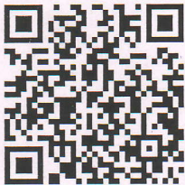
ГРАФИК ПЛАТЕЖЕЙ* к договору (контракту) от 28.10.2022 г. № 163324