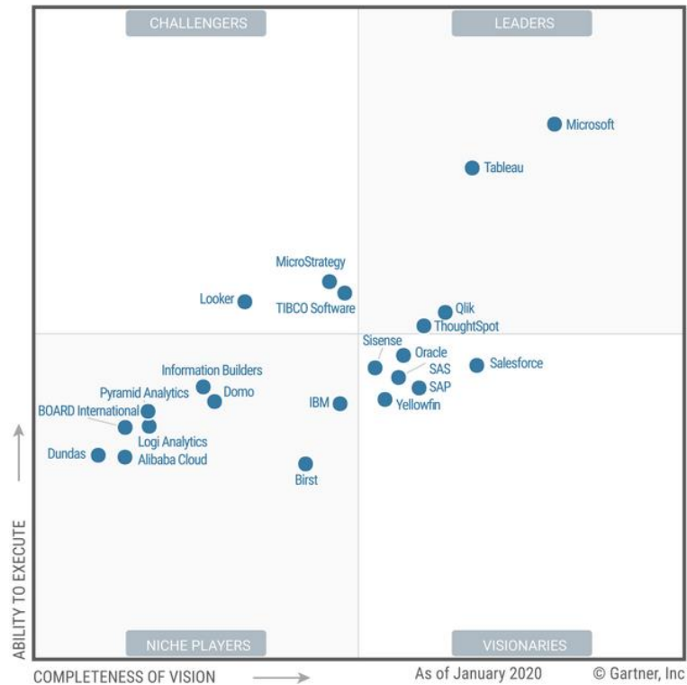
Рис. 3 — Gartner's Magic Quadrant for Analytics and Business Intelligence Platforms 2020