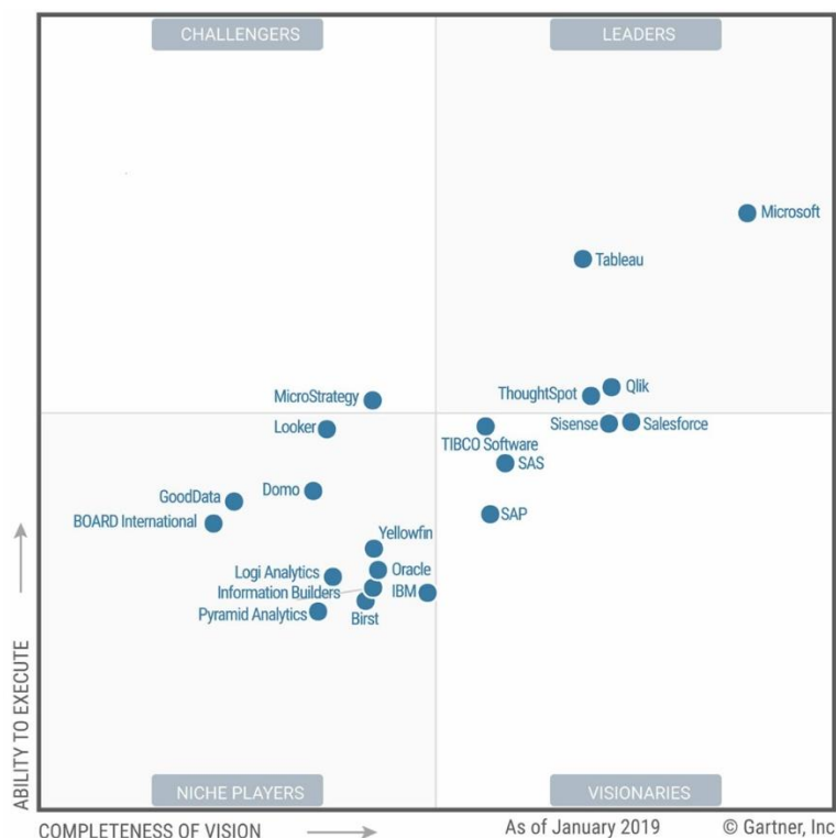
Рис. 2 – Gartner's Magic Quadrant for Analytics and Business Intelligence Platforms