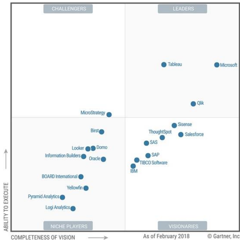
Рис. 1 – Gartner's Magic Quadrant for Analytics and Business Intelligence Platforms 2018

Выбор аналитического инструмента и облачной платформы для визуализации должен определяться на основе самого популярного мирового аналитического отчета «Gartner's Magic Quadrant for Analytics and Business Intelligence Platforms». Отчет включает в себя всех крупных мировых вендоров (Oracle, SAP, SAS, IBM, Qlik, Tableau и т.д.), выбирая из них только самых сильных.