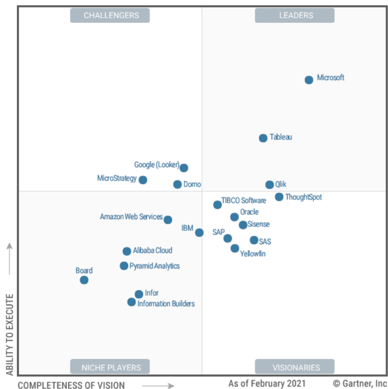
Рис. 4 — Gartner's Magic Quadrant for Analytics and Business Intelligence Platforms 2021

Облачное программное обеспечение для визуализации и анализа данных (Business Intelligence), должно иметь облачную версию и предоставлять доступ именным пользователям в количестве 5 человек.