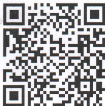
ГРАФИК ПЛАТЕЖЕЙ* к договору (контракту) от 31.10.2022 г. № 90

между DIAMAND BUILDER МЧЖ и Тайлок туман хокимлиги на общую сумму 5600000,00