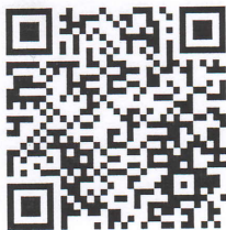
ГРАФИК ПЛАТЕЖЕЙ* к договору (контракту) от 31.10.2022 г. № 91

между DIAMAND BUILDER МЧЖ и Тайлок туман хокимлиги на общую сумму 22865000,00