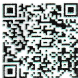
ГРАФИК ПЛАТЕЖЕЙ* к договору (контракту) от 26.10.2022 г. № 452-2-35-ХТ/2022

между «AL ASAD SERVICE» МСНУ и Жондор туман ХТБ на общую сумму 299992010,00