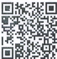
ГРАФИК ПЛАТЕЖЕЙ* к договору (контракту) от 26.10.2022 г. № 376

между "SHUXRAT PRO MEBEL" MCHJ и Коракул тумани тиббиёт коллежи на общую сумму 171200000,00