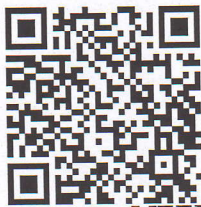
ГРАФИК ПЛАТЕЖЕЙ* к договору (контракту) от 09.11.2022 г. № 45

между МЕБЕЛЬ ЭЛЕКТРОНИКА МСНУ и Республика Маънавият ва маърифат Маркази Қорақалпоғистон булими на общую сумму 215525000,00