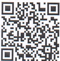
ГРАФИК ПЛАТЕЖЕЙ* к договору (контракту) от 10.11.2022 г. № ОБ-20

между "Нурабод курилиш савдо" МЧЖ и Учкургон ХТБ марказ на общую сумму 471861350,00