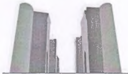
Ak-saray construction project

O'ZBEKISTON RESPUBLIKASI TOSHKENT SHAHAR CHILONZOR TUMANI “AK-SARAY CONSTRUCTION PROJECT” MA’SULIYATI CHEKLANGAN JAMIYATI