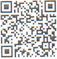
ГРАФИК ПЛАТЕЖЕЙ* к договору (контракту) от 16.11.2022 г. № 2

между Rawaj Moynaq Qurilis ЖШЖ и Бузотов тумани Хокимлиги на общую сумму 618500000,00