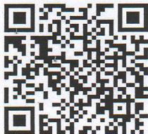
ГРАФИК ПЛАТЕЖЕЙ* к договору (контракту) №2 от 17.11.2022г

между "ASAD SHOX QURILIS" OOO и Бердак номидаги Коракалпок давлат университети на общую сумму 1 125 495 158,00