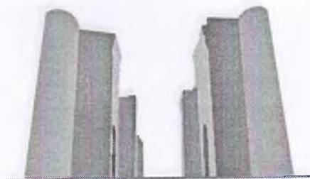
Ak-saray construction project

ЎЗБЕКИСТОН RESPUBLIKASI TOSHKENT SHAHAR CHILONZOR TUMANI “AK-SARAY CONSTRUCTION PROJECT” MA’SULIYATI CHEKLANGAN JAMIYATI