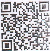
ГРАФИК ПЛАТЕЖЕЙ* к договору (контракту) от 25.10.2022 г. № 62