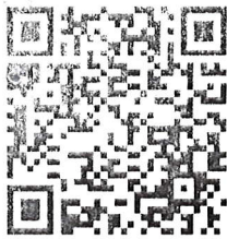
ГРАФИК ПЛАТЕЖЕЙ* к договору (контракту) от 18.11.2022 г. № 57

между MCHJ GIGO PLUS и Янги Наманган туман ХТБ Марказ на общую сумму 66807000,00