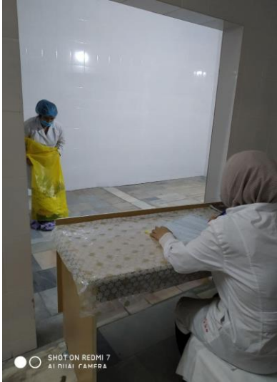
Фото ПРАЧЕЧНОГО ЦЕХА