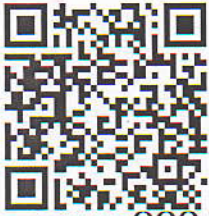
ГРАФИК ПЛАТЕЖЕЙ* к договору (контракту) от 21.11.2022 г. № 1

между ООО "SULTANBEK STROY" и Тахиатош тумани Халк таълими булими (МБ) на общую сумму 950263839,00