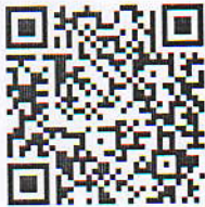
ГРАФИК ПЛАТЕЖЕЙ* к договору (контракту) от 30.11.2022 г. №1

между ООО "MODERN PROEKT 1" и Ангрен Шахар Тиббиёт Бирлашмаси на общую сумму 280000000