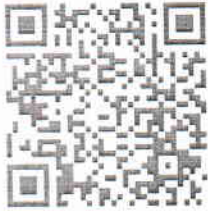
ГРАФИК ПЛАТЕЖЕЙ* к договору (контракту) от 03.11.2022 г. № 28

между BURGUT LYX и Тойлок тумани 1-сон касб-хунар мактаби на общую сумму 19925000,00