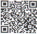
ГРАФИК ПЛАТЕЖЕЙ* к договору (контракту) от 02.11.2022 г. №1/188

между ООО KING DRIVE и КР ССВ нинг Ихтисослаштирилган автотранспорт корхонаси ДК на общую сумму 29 980 000=00