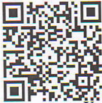
ГРАФИК ПЛАТЕЖЕЙ* к договору (контракту) от 02.11.2022 г. № 5

между Универсал энерго файз строй и Тахнатош тумани Халк таълими булими (МБ) на общую сумму 884580115,00