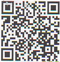
ГРАФИК ПЛАТЕЖЕЙ* к договору (контракту) от 27.10.2022 г. № 27-22

между ООО "MODERN PROEKT NUKUS" и Тахиатош тумани Халк таълими бўлими (МБ) на общую сумму 22800000,00