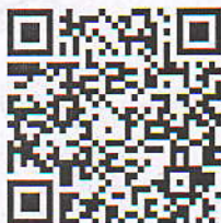
ГРАФИК ПЛАТЕЖЕЙ* к договору (контракту) от 12.12.2022 г. № 1

между ООО "Турон бунёдкор ИК" и 19-сон болалар мусика ва санъат мактаби на общую сумму 116050000,00