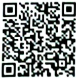
ГРАФИК ПЛАТЕЖЕЙ* к договору (контракту) от 12.12.2022 г. № 312-4-57-ОВ/2022

между Кашкадарьинская проектно-изыск.эксп и Дехконобод туман ободолаштириш бошкармаси на общую сумму 24500000,00