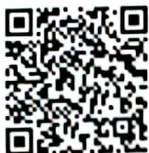
ГРАФИК ПЛАТЕЖЕЙ* к договору (контракту) от 12.12.2022 г. № 313-4-57-ОВ/2022

между Кашкадарьинская проектно-изыск.эксеп и Дехконобод туман ободонлаштириш бошкармаси на общую сумму 17650000,00