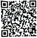
ГРАФИК ПЛАТЕЖЕЙ* к договору (контракту) от 12.12.2022 г. № 317-4-57-ОВ/2022

между Кашкадарьинская проектно-изыск.эксн и Дехконобод туман ободолаштириш бошкармаси на общую сумму 22400160,00