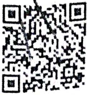
ГРАФИК ПЛАТЕЖЕЙ* к договору (контракту) от 14.11.2022 г. № 80.

между "Вобкент Бунёдкор Таъмир" ИТК М. Ч. Ж" и Вобкент туман Ободонлаштириш бўлими