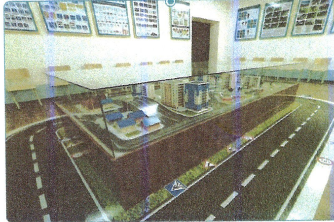
Ўқув хонаси жиҳозлари