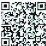
ГРАФИК ПЛАТЕЖЕЙ* к договору (контракту) от 19.12.2022 г. № 558-2-35-ХТ/2022

между Шухратбек Шерзодбек курилиш МЧЖ и Жондор туман ХТБ на общую сумму 33000000,00