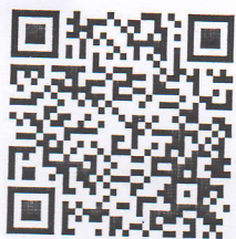
ГРАФИК ПЛАТЕЖЕЙ* к договору (контракту) от 21.12.2022 г. № 13

между Бухоро кабел каршилиги кичик корхонаси и Вобкент туман тиббиёт бирлашмаси на общую сумму 26317500,00