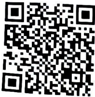
ГРАФИК ПЛАТЕЖЕЙ* к договору (контракту) от 20.12.2022 г. № 387-22/4

между Гиждувон курилиш лойиха МЧЖ и Қизилтепа туман ХТБ на общую сумму 9500000,00