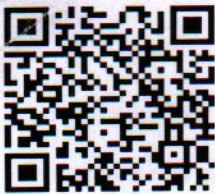
ГРАФИК ПЛАТЕЖЕЙ* к договору (контракту) от 22.12.2022 г. № 13

между ООО "HAWAII" и Конликул тумани Тиббиет бирлашмаси на общую сумму 367600000,00