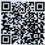
ГРАФИК ПЛАТЕЖЕЙ* к договору (контракту) от 17.11.2022 г. № 22-07

между "ООО Мастер-Арх" и Коракалпогистон Республикаси Вазирлар Кенгашининг ягона буюртмачи хизмати "Инжиниринг компанияси" (Фонд) на общую сумму 12040000,00