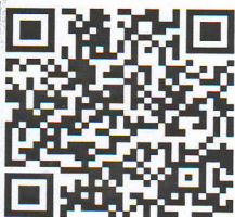
ГРАФИК ПЛАТЕЖЕЙ* к договору (контракту) от 06.12.2022 г. № 2022/16

между ООО "ШОПУР" и Ислом Каримов номидаги ТДТУ академик лицейи на общую сумму 183000000,00