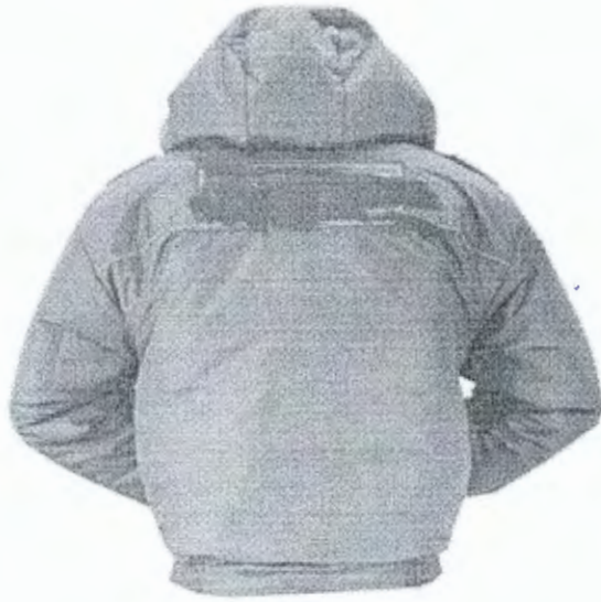
Куртка зимняя полиции с шевронами (40 / 158 - 164)