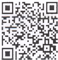
ГРАФИК ПЛАТЕЖЕЙ* к договору (контракту) от 09.03.2022 г. № 01

между SENTRAL- MARKET MCHJ и Мирзаобод туман МТБ на общую сумму 498000000,00