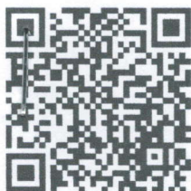
ГРАФИК ПЛАТЕЖЕЙ* к договору (контракту) от 28.03.2022 г. № 3-2022/03

между "Сирдарё мебел фабрика" МЧЖ и Сирдарё вилоят Курилиш бош бошкармаси на общую сумму 15000000,00