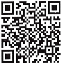
ГРАФИК ПЛАТЕЖЕЙ* к договору (контракту) от 25.03.2022 г. № 12109

между "Олтин тола замини" хусусий фирмаси и Гиждувон туман МТБ на общую сумму 677900000,00