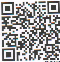
ГРАФИК ПЛАТЕЖЕЙ* к договору (контракту) от 28.02.2022 г. № 8732

между OUS-MAXBUILDING МЧЖ и Жанубий Мирзачул магистрал канали бошкармаси на общую сумму 104831953,00