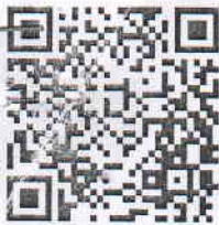
ГРАФИК ПЛАТЕЖЕЙ* к договору (контракту) от 09.03.2022 г. №2

между ХК "Лакома" и Кегейли тумани тиббиёт бирлашмаси на общую сумму 28000000,00