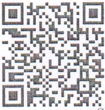
ГРАФИК ПЛАТЕЖЕЙ* к договору (контракту) от 20.04.2022 г. № 2

между SIRDARYO DAVR SERVIS и Сирдарё вилоят информатика ва ахборот технологияларга ихтисослаштирилган таянч мактаб интернати на общую сумму 499672000,00