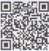
ГРАФИК ПЛАТЕЖЕЙ* к договору (контракту) от 18.04.2022 г. № 15770

между "Сухроб Бухорий" МЧЖ и Бухоро сахар ХТБ на общую сумму 76 400 000,00