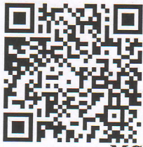
ГРАФИК ПЛАТЕЖЕЙ* к договору (контракту) от 14.04.2022 г. № 1

между МСНЖ "EVALUATE THE TASTE TO ORDER" и Тошкент вилояти тери-таносил касалликлари дидансери на общую сумму 131422200,00