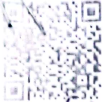
ГРАФИК ПЛАТЕЖЕЙ* к договору (контракту) от 06 April 2022 г. №

между Бухоровидаш Тревел Травелл и Вобкент туман Ободоланштириш булими на общую сумму