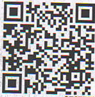
ГРАФИК ПЛАТЕЖЕЙ* к договору (контракту) от 13.05.2022 г. № 7

между ЖШЖ "GOLDEN PRIDE KHUDJEYLI" и Конликул тумани Мактабгача таълим булими (МБ) на общую сумму 499232000,00