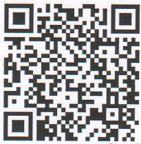
ГРАФИК ПЛАТЕЖЕЙ* к договору (контракту) от 25.04.2022 г. № 19

между SAODAT-BARAKA и Тошкент вилояти тери-таносил касалликлари дипансери на общую сумму 101136000,00