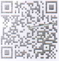
ГРАФИК ПЛАТЕЖЕЙ* к договору (контракту) от 12.05.2022 г. № 34

между ООО "COLOR FORCE" и Самарканд шаҳар ХТБ марказ на общую сумму 70996326,00